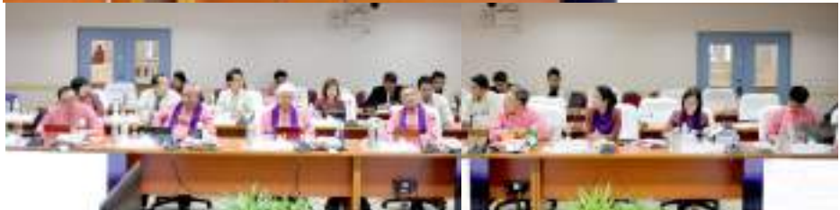
ภาพบรรยากาศในการประชุมสภามหาวิทยาลัยพะเยา ครั้งที่ 6/2563 ณ ห้องประชุมบวรรัตนประสิทธิ์ ชั้น 2 สำนักงานอธิการบดี มหาวิทยาลัยพะเยา