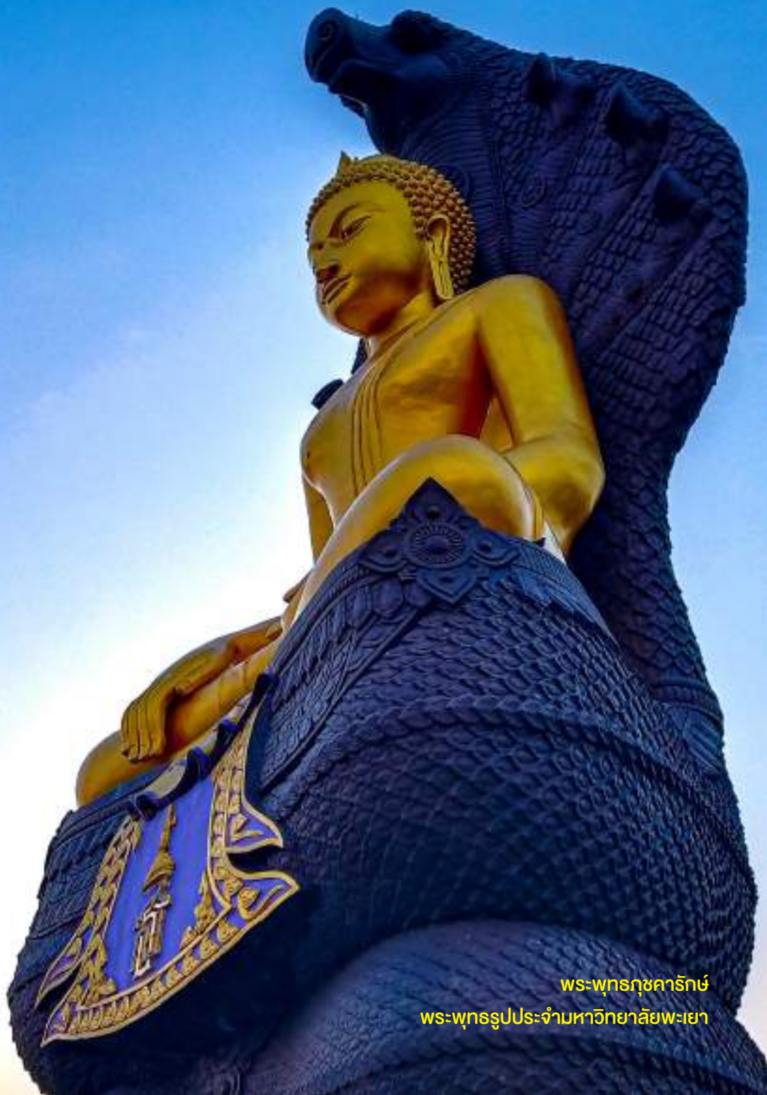
พระพุทธรูปปางสมาธิ พระพุทธรูปประจำมหาวิทยาลัยพะเยา