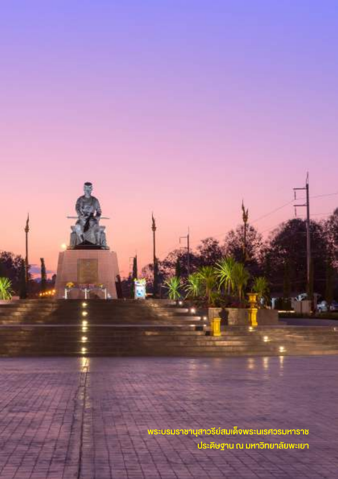
พระบรมราชานุสาวรีย์สมเด็จพระนเรศวรมหาราช ประดิษฐาน ณ มหาวิทยาลัยพะเยา