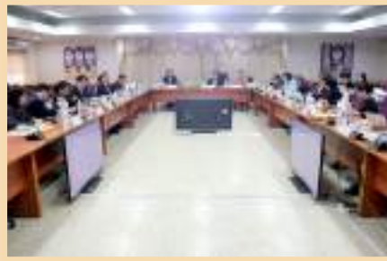
ภาพบรรยากาศ ในการประชุมสภามหาวิทยาลัยพะเยา ครั้งที่ 1/2563 ณ ห้องประชุมบวร รัตนประสิทธิ์ ชั้น 2 สำนักงานอธิการบดี มหาวิทยาลัยพะเยา