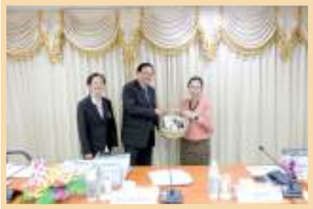
อธิการบดี ได้มอบกระเช้าของขวัญสวัสดิ์ตีปีใหม่ให้กับ อดีตนายกสภามหาวิทยาลัยพะเยา