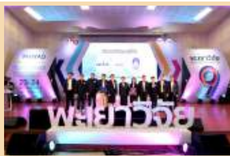
รูปพิธีลงนามบันทึกความเข้าใจ (MOU) ระหว่าง มหาวิทยาลัยพะเยา และสำนักงานนวัตกรรมแห่งชาติ (องค์การมหาชน) (NIA)