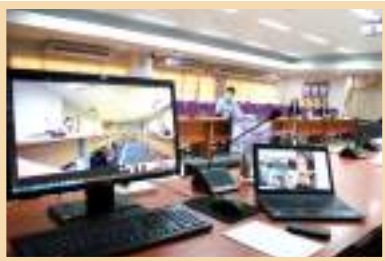
รูปการประชุมสภามหาวิทยาลัยพะเยา ผ่านสื่ออิเล็กทรอนิกส์ (Microsoft Teams)