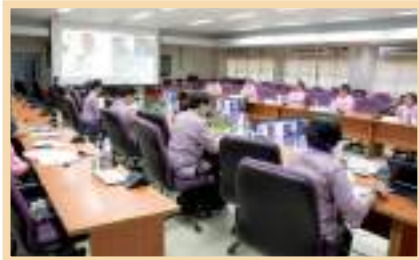
รูปการประชุมคณะกรรมการส่งเสริมกิจการมหาวิทยาลัยพะเยาผ่านสื่ออิเล็กทรอนิกส์ (Microsoft Teams)