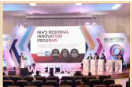
รูปการเสวนาพิเศษเรื่อง “ระบบทุนวิจัยใหม่ ภายใต้หน่วยบริหาร และจัดการทุนวิจัยและนวัตกรรม (PMU)”