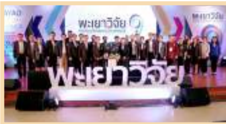
รูปพิธีเปิดการประชุมวิชาการระดับชาติพะเยาวิจัย ครั้งที่ 9

ในงานมีการเสวนาพิเศษเรื่อง “ระบบทุนวิจัยใหม่ ภายใต้หน่วยบริหารและจัดการทุนวิจัยและนวัตกรรม (PMU)” ทั้งนี้ภายในงานได้จัดพิธีลงนามบันทึกความเข้าใจ (MOU) ระหว่างมหาวิทยาลัยพะเยาและสำนักงานนวัตกรรมแห่งชาติ (องค์การมหาชน) (NIA) เพื่อสร้าง พัฒนา และส่งเสริมธุรกิจนวัตกรรมเพื่อสังคมของไทยในพื้นที่กลุ่มจังหวัดภาคเหนือตอนบน 2 โดยผ่านความร่วมมือในการจัดตั้งหน่วยขับเคลื่อนนวัตกรรมเพื่อสังคม (Social Innovation Driving Unit : SID) เพื่อช่วยบ่มเพาะ สนับสนุน และให้คำปรึกษาในเชิงบูรณาการให้กับธุรกิจนวัตกรรมเพื่อสังคมในพื้นที่