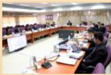
รูปการประชุมสภามหาวิทยาลัยพะเยา (ชุดเก่า) ณ ห้องประชุมบวร รัตนประสิทธิ์ ชั้น 2 สำนักงานอธิการบดีมหาวิทยาลัยพะเยา

ต่อมาประกาศสำนักนายกรัฐมนตรี ได้มีพระบรมราชโองการโปรดเกล้าโปรดกระหม่อม แต่งตั้งนายกสภามหาวิทยาลัยและกรรมการสภามหาวิทยาลัยผู้ทรงคุณวุฒิของมหาวิทยาลัยพะเยา ประกาศ ณ วันที่ 31 สิงหาคม พ.ศ. 2563 จึงได้มีการจัดประชุมสภามหาวิทยาลัยพะเยา (ชุดใหม่) โดยเริ่มจากการประชุมสภามหาวิทยาลัยพะเยา ครั้งที่ 6/2563 ณ ห้องประชุมบวร รัตนประสิทธิ์ ชั้น 2 อาคารสำนักงานอธิการบดี มหาวิทยาลัยพะเยา และการประชุมสภามหาวิทยาลัยพะเยา ครั้งที่ 7/2563 และ 8/2563 ณ วิทยาลัยการจัดการ มหาวิทยาลัยพะเยา กรุงเทพมหานคร