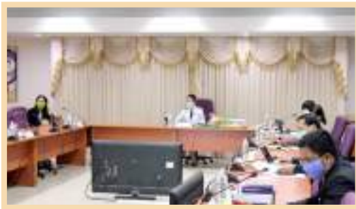
ภาพบรรยากาศในการประชุม สภามหาวิทยาลัยพะเยา ครั้งที่ 3/2563 ณ ห้องประชุมบวร รัตนประสิทธิ์ ชั้น 2 สำนักงานอธิการบดี มหาวิทยาลัยพะเยา

การประชุมสภามหาวิทยาลัยพะเยา ครั้งที่ 3/2563 เมื่อวันที่ 25 เมษายน 2563 เวลา 09.00 น. ได้จัดให้มีการประชุมสภามหาวิทยาลัยพะเยาออนไลน์ผ่านระบบ VDO Conference โดยมีผู้เข้าร่วมประชุมผ่านระบบ VDO Conference ณ ห้องประชุม L807 ชั้น 8 วิทยาลัยการ จัดการ มหาวิทยาลัยพะเยา อาคารเวฟเพลส ถนนวิทยุ แขวงลุมพินี เขตปทุมวัน กรุงเทพมหานคร ห้องประชุมบวร รัตนประสิทธิ์ ชั้น 2 อาคารสำนักงานอธิการบดี มหาวิทยาลัยพะเยา ตำบลแม่กา อำเภอเมือง จังหวัดพะเยา และจากบ้านพักหรือสถานที่สะดวกของกรรมการสภามหาวิทยาลัย ผ่านสื่ออิเล็กทรอนิกส์ก่อนการประชุมเนื่องในโอกาสปีใหม่ไทย มหาวิทยาลัยได้เตรียมน้ำขมิ้นส้มป่อย สำหรับคำหัวขอขมาและขอพร กรรมการสภามหาวิทยาลัยผู้ทรงคุณวุฒิ เพื่อเป็นสิริมงคลแก่ ผู้บริหารและบุคลากรในการปฏิบัติงานการประชุมในครั้งนี้ รศ.ดร.สุภกร พงศบางโพธิ์ อธิการบดี ได้มอบหมายให้ นายแพทย์สรวิศ บุญญฐิติ ผู้ช่วยอธิการบดี รายงานสถานการณ์และมาตรการป้องกันการแพร่ระบาดของ COVID-19 ของมหาวิทยาลัยพะเยา ผศ.ดร.ชลธิดา เทพหินลับ รองอธิการบดี ฝ่ายวิชาการและประกันคุณภาพ รายงานเรื่องการจัดการเรียนการสอนออนไลน์ ในสถานการณ์ COVID-19 ของมหาวิทยาลัยพะเยาและรศ.ดร.เสมอ ถาน้อย รองอธิการบดีฝ่ายวิจัย และนวัตกรรม รายงานผลการจัดอันดับ THE Impact Rankings 2020 มหาวิทยาลัยพะเยา