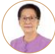
ศาสตราจารย์เกียรติคุณ คุณหญิงไขศรี ศรีอรุณ