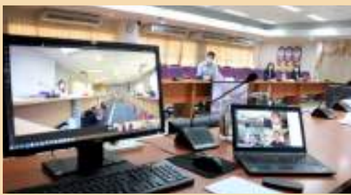
ภาพบรรยากาศในการประชุม สภามหาวิทยาลัยพะเยา ครั้งที่ 1/2563 ผ่านสื่ออิเล็กทรอนิกส์ (Microsoft Teams)

การประชุมสภามหาวิทยาลัยพะเยา ครั้งที่ 2/2563 เมื่อวันที่ 28 มีนาคม 2563 เวลา 09.30 น. ได้จัดให้มีการประชุมสภามหาวิทยาลัยพะเยาออนไลน์ผ่านระบบ VDO Conference เป็นครั้งแรก โดยมีผู้เข้าร่วมประชุมผ่านระบบ VDO Conference ณ ห้องประชุม L807 ชั้น 8 วิทยาลัยการจจัดการ มหาวิทยาลัยพะเยา อาคารเวฟเพลส ถนนวิทยุ แขวงลุมพินี เขตปทุมวัน กรุงเทพมหานคร ห้องประชุมบวร รัตนประสิทธิ์ ชั้น 2 อาคารสำนักงานอธิการบดี มหาวิทยาลัยพะเยา ตำบลแม่กา อำเภอเมือง จังหวัดพะเยา และบ้านพักหรือสถานที่สะดวกของกรรมการสภามหาวิทยาลัย ผ่านระบบสื่ออิเล็กทรอนิกส์