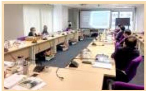
ภาพบรรยากาศในการประชุม สภามหาวิทยาลัยพะเยา ครั้งที่ 3/2563 ณ ห้องประชุม L807 ชั้น 8 วิทยาลัยการจัดการ มหาวิทยาลัยพะเยา กรุงเทพมหานคร