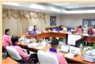
รูปการประชุมสภามหาวิทยาลัยพะเยา (ชุดใหม่) ณ ห้องประชุมบวร รัตนประสิทธิ์ ชั้น 2 สำนักงานอธิการบดีมหาวิทยาลัยพะเยา