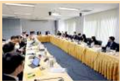
รูปการประชุมสภามหาวิทยาลัยพะเยา (ชุดใหม่) ณ ห้องประชุม L 807 วิทยาลัยการจัดการ มหาวิทยาลัยพะเยา กรุงเทพมหานคร