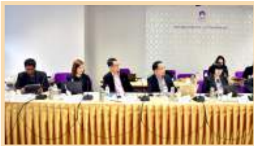
ภาพบรรยากาศในการประชุม สภามหาวิทยาลัยพะเยา ครั้งที่ 7/2563 ณ ห้องประชุม L807 ชั้น 8 วิทยาลัยการจัดการ มหาวิทยาลัยพะเยา กรุงเทพมหานคร