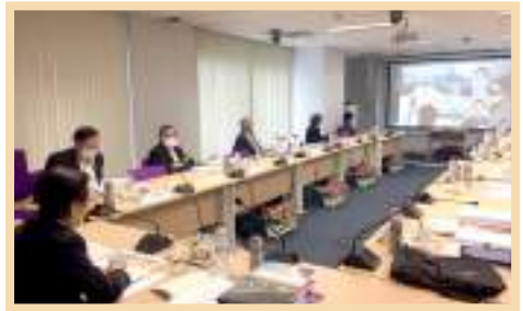
ภาพบรรยากาศในการประชุม สภามหาวิทยาลัยพะเยา ครั้งที่ 2/2563 ณ ห้องประชุมบวร รัตนประสิทธิ์ ชั้น 2 สำนักงานอธิการบดี มหาวิทยาลัยพะเยา