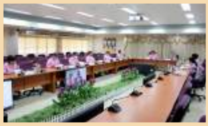
รูปการประชุมคณะกรรมการส่งเสริมกิจการมหาวิทยาลัยพะเยา ณ ห้องประชุมบวร รัตนประสิทธิ์ ชั้น 2 สำนักงานสภามหาวิทยาลัยพะเยา