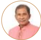
ศ.(เกียรติคุณ) ดร.เกต กฤตพันธ์