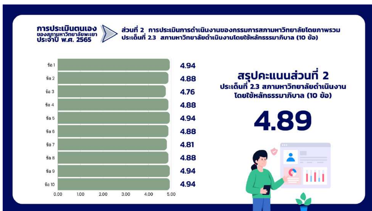
ภาพที่ 9 กราฟแสดงสรุปผลคะแนนประเด็นที่ 2.3 สภามหาวิทยาลัยดำเนินงานโดยใช้หลักธรรมาภิบาล

คณะกรรมการสภามหาวิทยาลัยประกอบด้วย ผู้ทรงคุณวุฒิด้านการศึกษา การบริหารงานภาคเอกชน ด้านการบริหารงานภาครัฐ เช่น สาธารณสุข การเกษตรฯ ทวีพยากรธรรมชาติ ทำให้มีความหลากหลายทางความคิดในการนำเสนอข้อแนะนำที่เป็นประโยชน์