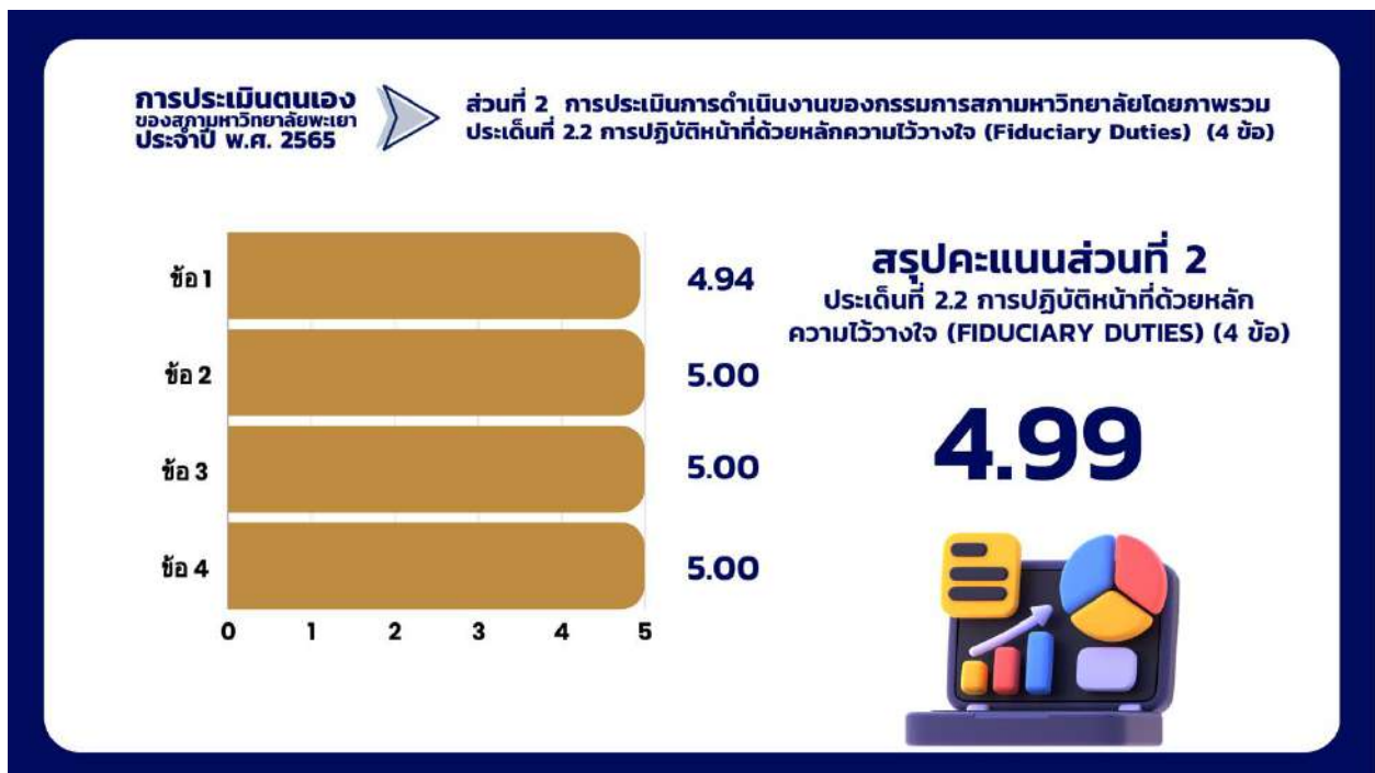
ภาพที่ 7 กราฟแสดงสรุปผลคะแนนประเด็นที่ 2.2 การปฏิบัติหน้าที่ด้วยหลักความไว้วางใจ (Fiduciary Duties)

ที่ผ่านมามาคณะกรรมการสภามหาวิทยาลัยทุกท่าน ได้ปฏิบัติหน้าที่อย่างเต็มกำลัง ด้วยความรอบคอบ รวมถึงการให้ข้อเสนอแนะต่าง ๆ ที่เป็นประโยชน์ต่อการดำเนินงานของมหาวิทยาลัย