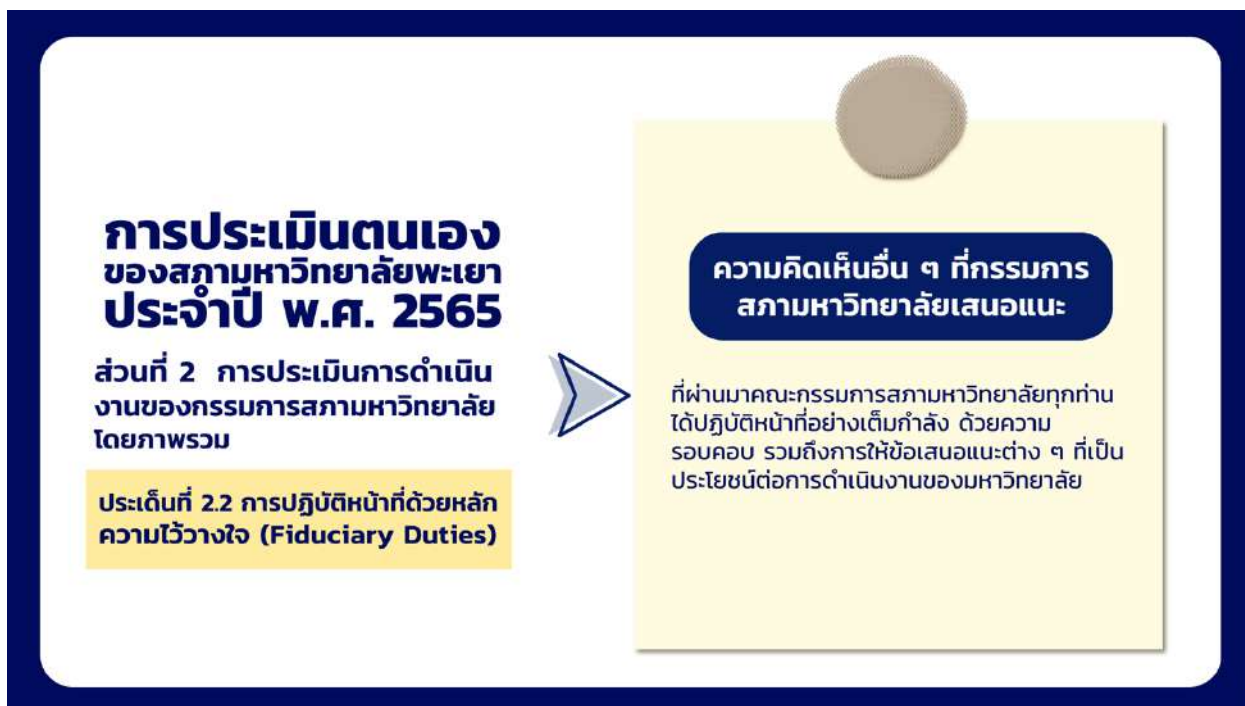
ภาพที่ 8 แสดงความคิดเห็นอื่น ๆ ที่กรรมการสภามหาวิทยาลัยเสนอแนะในประเด็นที่ 2.2 การปฏิบัติหน้าที่ด้วยหลักความไว้วางใจ (Fiduciary Duties)