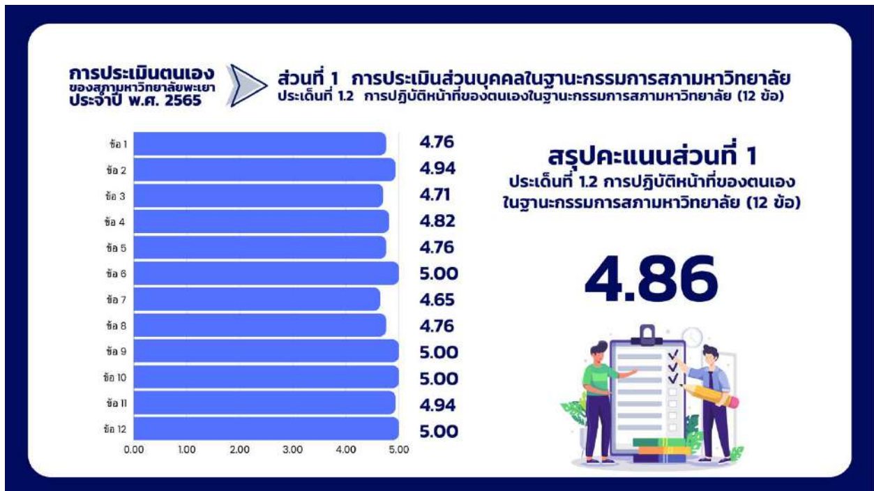
ภาพที่ 4 กราฟแสดงสรุปผลคะแนนประเด็นที่ 1.2 การปฏิบัติหน้าที่ของตนเองในฐานะกรรมการสภามหาวิทยาลัย