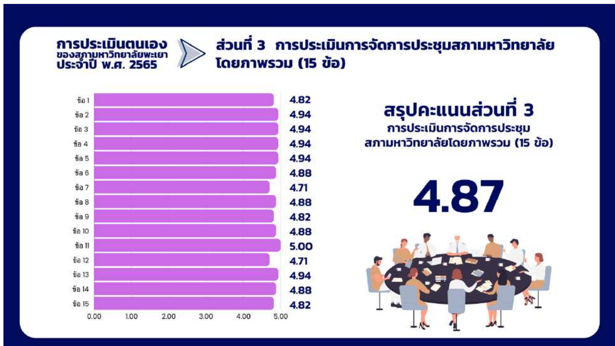
ภาพที่ 11 กราฟแสดงสรุปผลคะแนนส่วนที่ 3 การประเมินการจัดการประชุมสภามหาวิทยาลัย โดยภาพรวม