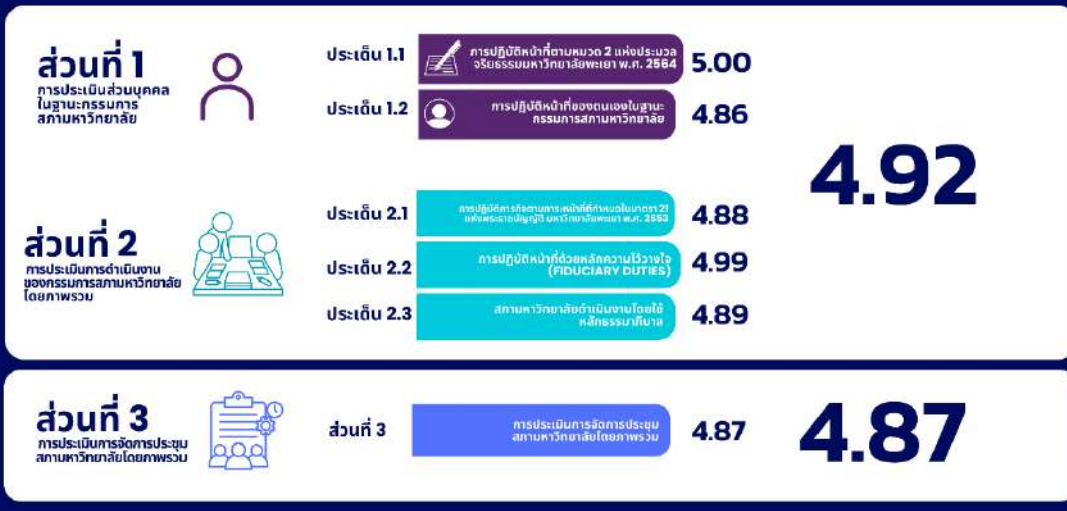
ภาพที่ 1 กราฟแสดงสรุปผลคะแนนในภาพรวม ส่วนที่ 1 - 3