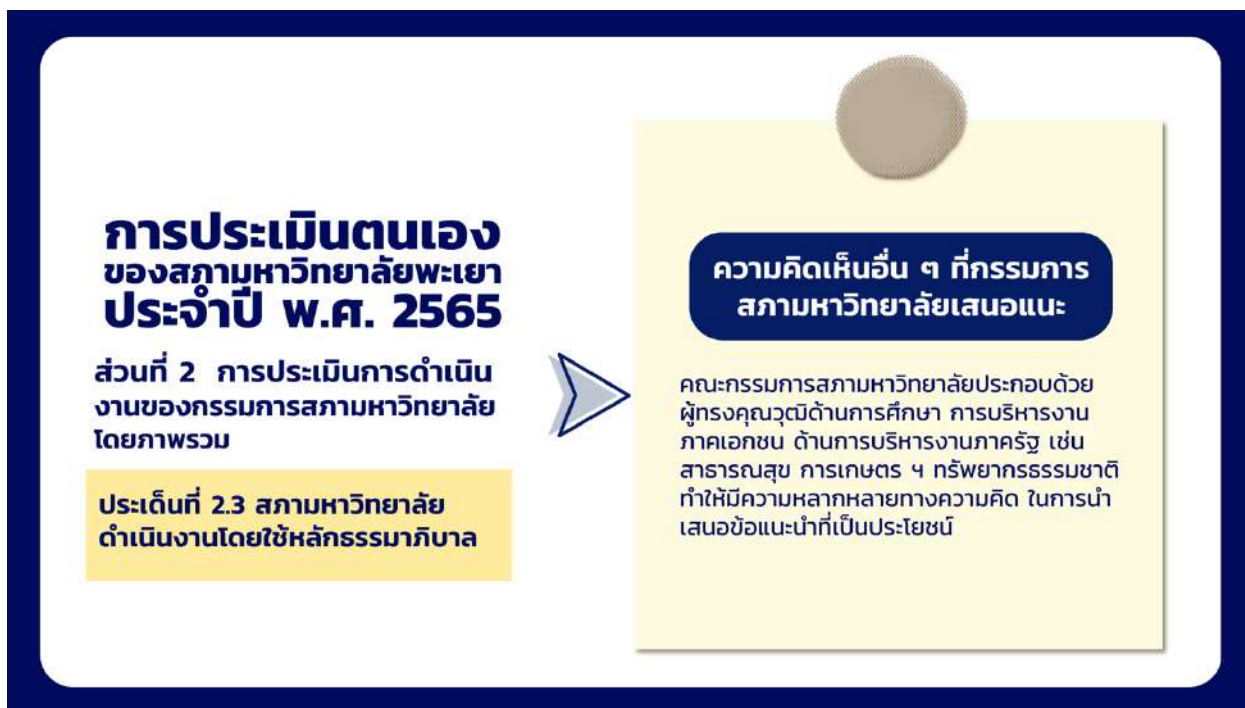
ภาพที่ 10 แสดงความคิดเห็นอื่น ๆ ที่กรรมการสภามหาวิทยาลัยเสนอแนะในประเด็นที่ 2.3 สภามหาวิทยาลัยดำเนินงานโดยใช้หลักธรรมาภิบาล