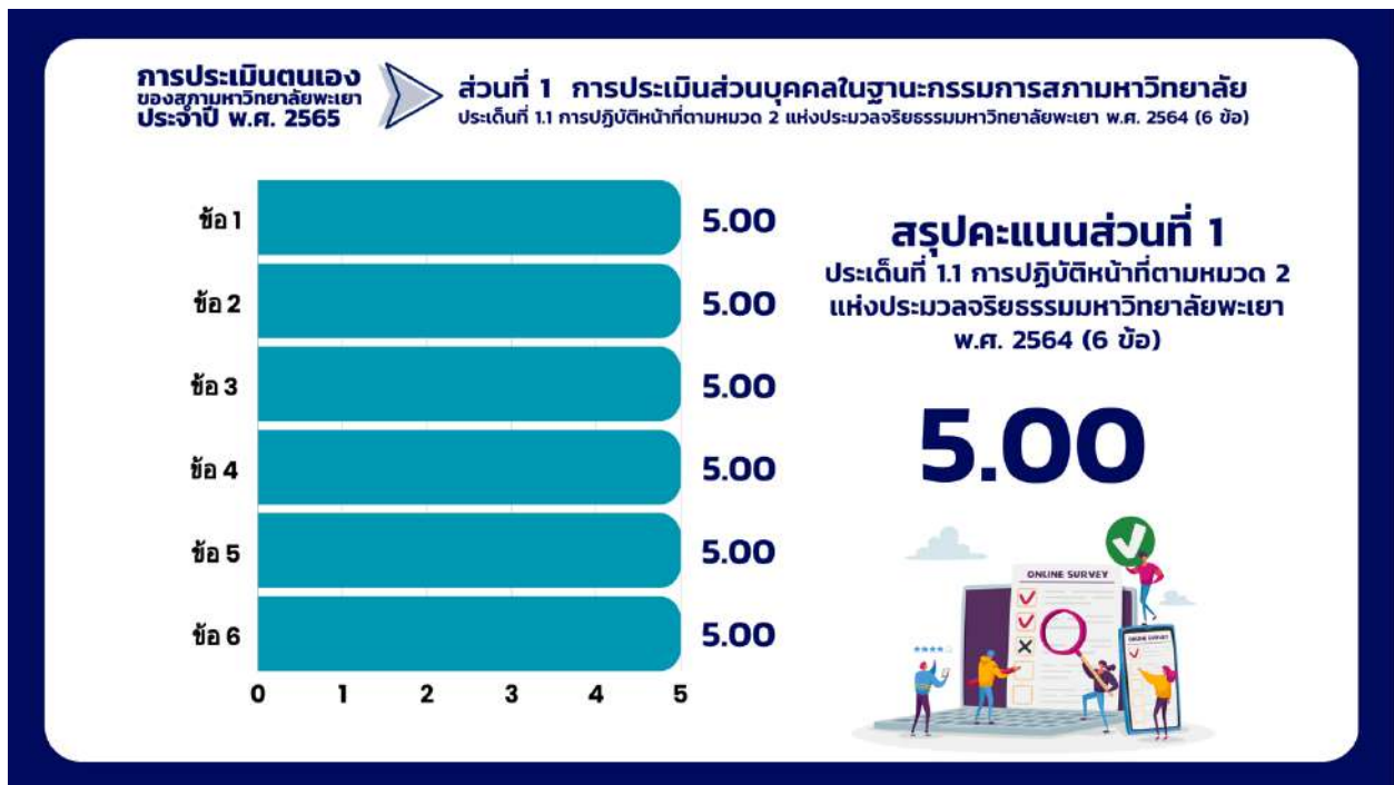
ภาพที่ 2 กราฟแสดงสรุปผลคะแนนประเด็นที่ 1.1 การปฏิบัติหน้าที่ตามหมวด 2 แห่งประมวลจริยธรรมมหาวิทยาลัยพะเยา พ.ศ. 2564